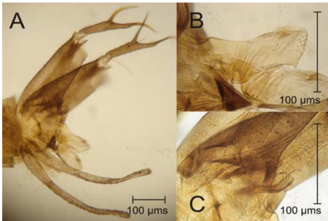
Figura 2. Lutzomyia camposi (Rodríguez, 1952). A. Terminalia masculina. B. Parámero. C. Grupo de setas.

ficada fácilmente por presentar la coxita arqueada, llama la atención que en las claves taxonómicas disponibles (Forattini 1973; Young 1979; Young y Duncan 1994; Galati 2003) no se mencione esta evidente característica morfológica que podría ser de utilidad en la determinación de especie.