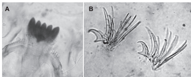
Figura 1. Detalles de la larva de M. tillandsia . A. Liguilla, B. garras de los parápodos posteriores.

y plastrón ovoide cubriendo menos de 1/3 de la longitud del cuerno torácico (Fig. 2A), el patrón de coloración marrón claro típico de M. mikeschwartzi (Epler, 1999) esta ausente (Fig. 2B). Los ejemplares se ajustaron perfectamente a esta combinación de caracteres que permite separar los ejemplares de M. tillandsia del resto de sus congéneres neotropicales.