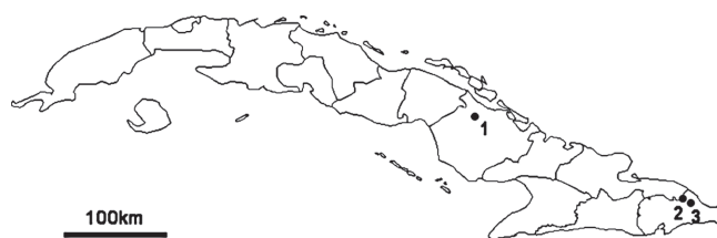
Figura 3. Localidades donde se encontraron ejemplares de M. tillandsia . 1) Reserva Ecológica Limones-Tuabaquey, Provincia de Camaguey; 2) La Melba, Parque Nacional Alejandro de Humboldt, Provincia de Holguín; 3) Monte Iberia, Parque Nacional Alejandro de Humboldt, Provincia de Guantánamo.