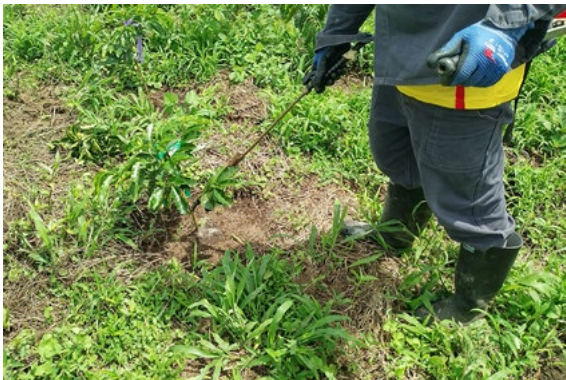
Figura 2. Aplicación en drench con aspersora modificada para el control de P. barberi .

propuesto a partir de un modelo lineal generalizado, asumiendo una distribución binomial para la variable de respuesta con función de enlace logit. Posteriormente se utilizó una prueba de contrastes ortogonales para identificar los tratamientos que fueron iguales o superiores al testigo relativo y luego una comparación entre los tratamientos insecticidas, diferentes al testigo relativo, con ajuste de Tukey Kramer. Adicionalmente, con los insecticidas que fueron diferentes estadísticamente al testigo absoluto o con los que mostraron mayor potencial de control, se determinó su eficacia teniendo en cuenta la reducción de número de individuos vivos por planta.