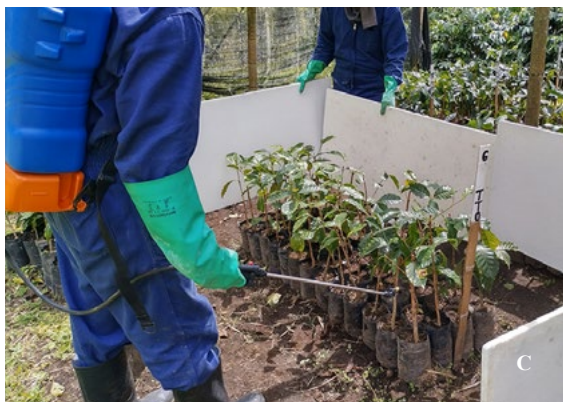
Figura 4. Aplicación de tratamientos A. Drench, a la base del tallo, con aspersora modificada. B. Hidróxido de calcio en drench con jeringa, a la base del tallo. C. Spirotetramat aplicado en aspersión al follaje con aspersora convencional.