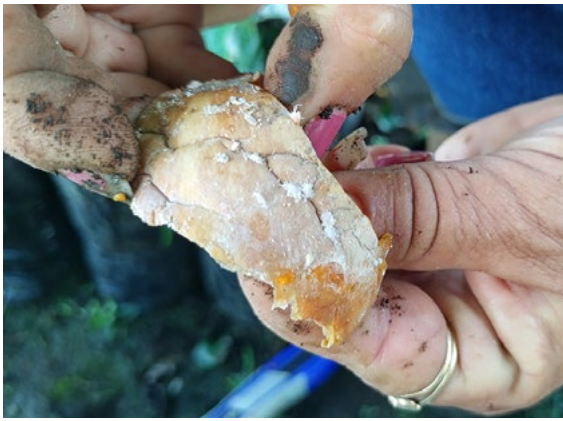
Figura 3. Infestación de Dysmicoccus sp. con secciones de fruto de C. moschata