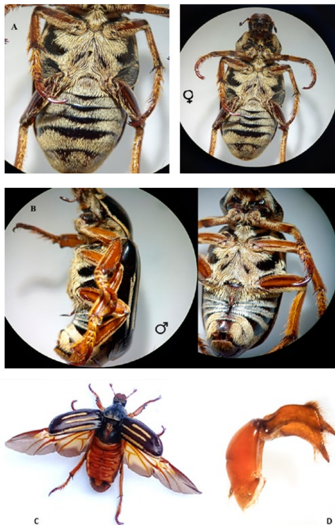
Figura 3. Morfología de Ancistrostoma klugii . A) vista ventral de la hembra con abdomen sin la espina y pigidio sinuoso. B) vista ventral y lateral del macho con provisto de una espina bien definida en la parte media de los dos esternitos abdominales. C) Ancistrostoma klugii con alas desprovistas. D) Edeago, vista lateral.

Abdomen. Abdomen recumbente, con 6 esternitos (Figura 3A). De los 152 adultos examinados en 76 de ellos se pudo apreciar una espina ventral bien definida en la parte media de los dos esternitos abdominales anteriores, reduciendo a los demás esternitos a la espina, siendo más estrechas y con apariencia de una fusión de esternitos ventralmente. Con pigidio encorvado ventralmente y hacia la parte anterior, facilitando la protección del aparato genital, edeago encorvado fuertemente esclerotizado (Figura 3B); la hembra con abdomen sin la espina, con el margen anterior del pigidio sinuoso (Figura 3A a ). Estas observaciones son similares a los mencionados en la clasificación de los escarabajos de la subfamilia Melolonthinae (Fuhrmann & Vaz-De-Mello, 2017; Katovich, 2008a; Pathania & Chandel, 2017; Ratcliffe et al., 2015).