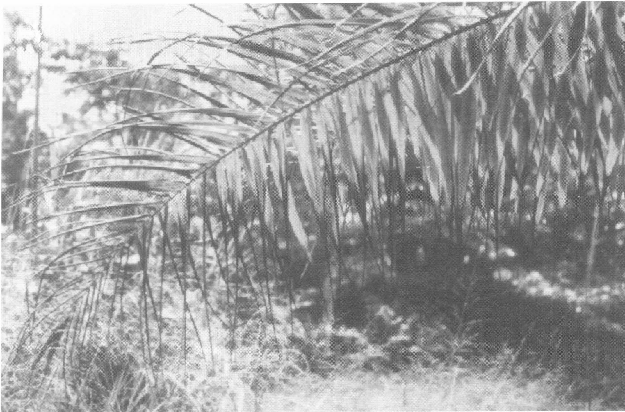
Figura 1. Secamiento de folíolos, del ápice hacia la base foliar.

tico de la enfermedad es la rapidez en la manifestación de los síntomas y la muerte de la palma, en 2-3 meses.