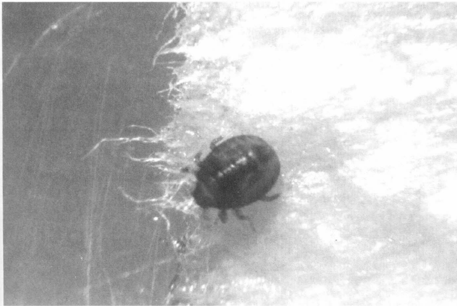
Figura 3. Ninfa de L. tumidifrons